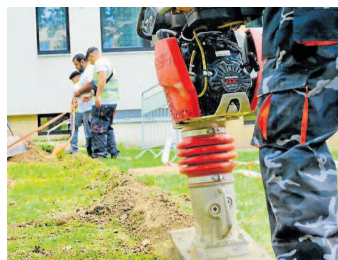
OPTICKÁ SÍŤ výrazně urychluje internet.

„Díky dobrému plánování a spolupráci s vedením měst a obcí nedochází k nadbytečným výkopovým pracím a jednotlivé oblasti se vždy připojují postupně, dle předem dohodnutého harmonogramu,“ vysvětluje Zdeněk Bumbálek, ředitel programu